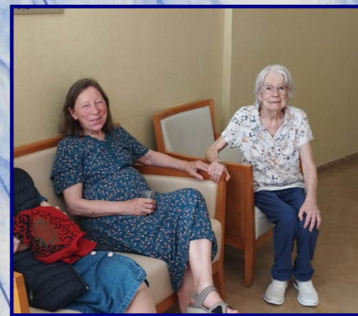
Une belle amitié ...