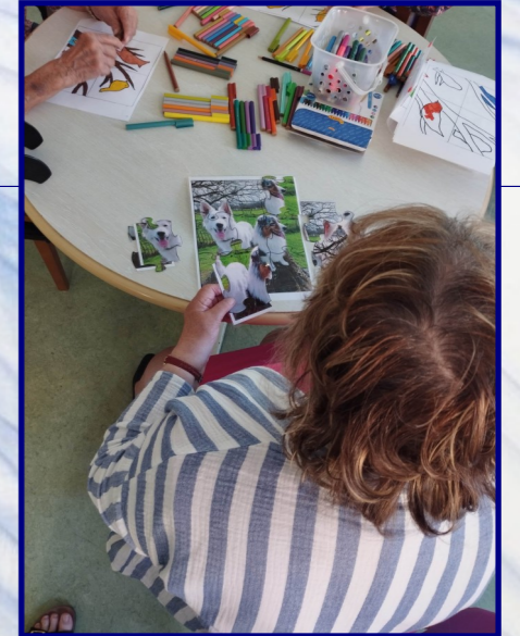
Un nouveau jeu de découverte de la médiation animal