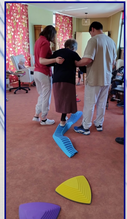
Travaillons notre équilibre