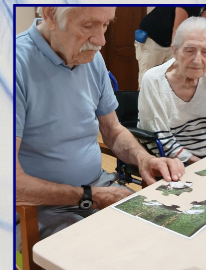
La pair aideance en animation