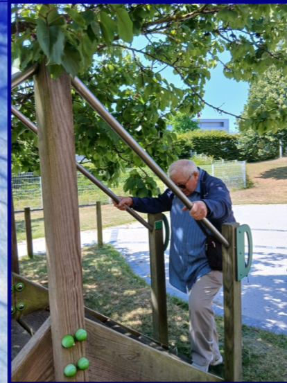
Gardons le sens de l'équilibre

3 COEUR QUATRE GRIMPANT ACE ENBUT ZIGZAG REHAUSSA EGO ENTER 7 TREMBLAY GAG IDIOT ADRESSE 9 VIA IMAGE CAMPING ABOLITION 4 KRAFT CRIBLER AMALGAMER CLUB LINDA DIGITAL AMUSEMENT ESSE LOYAL PLAIRAI BREVETIEZ GANG LUTTA TRUMEAU EDELWEISS IBIS QUOTA 8 ENJOIGNIT MALT RIFLE ABATJOUR ISLAMIQUE TROU USAIS BAIGNADE WARRANTER 5 6 DIMANCHE BOEUF LIVRER EMBATTRE CHECK PAELLA ENTRACTE