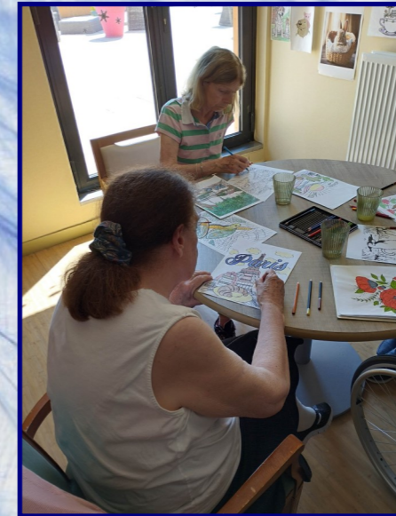
Les artistes à l'oeuvre